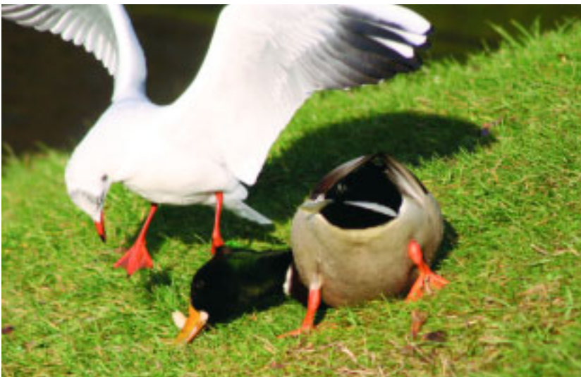
Ptaki tracą czas i energię na walki o rzucone kawałki chleba.