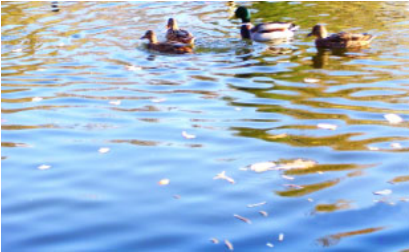
Rozmoknięty chleb, pływający w wodzie, jest ewidentnie szkodliwy dla ptaków.