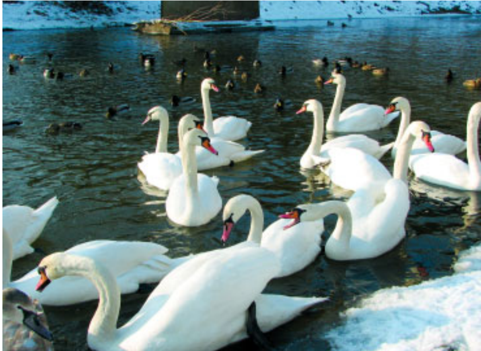
W Polsce zimy spędza 20-25 tysięcy łabędzi niemych, z czego znaczna część w miastach. Miejskie stada cechuje silna agresja w walce o podawany pokarm.

Widwany często w miastach mały, czarny ptak z białą tarczką skórną („łysiną”) na czole to łyska Fulica atra . Nie należy do kaczek, ale do rzędu chruścieli Rallidae i rodziny żurawinowatych Gruiiformes . Nie ma płaskiego,