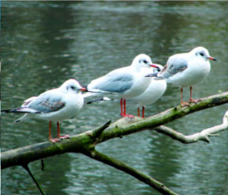
Najczęściej zimującym w polskich miastach przedstawicielem rodziny mew jest śmieszka.