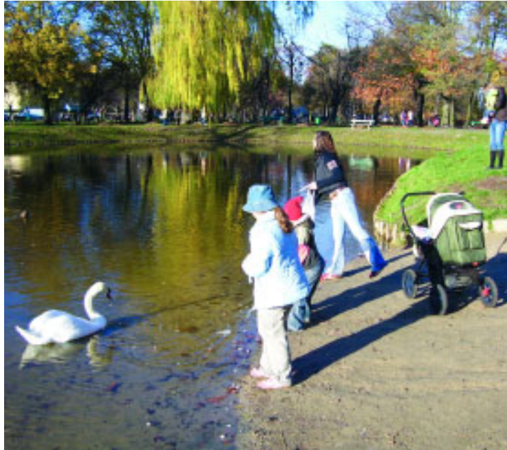
Karmienie ptaków wodnych jesienią to atrakcja i potrzeba serca dla najmłodszych i nie tylko, ale niestety szkodzi ptakom.

Wreszcie, 13 gatunków ptaków podlega w Polsce ochronie ustawą z 13 października 1995 r. – Prawo łowieckie (Dz. U. z 2002 r. Nr 42, poz. 372 ze zm.) i rozporządzeniem Ministra Środowiska z dnia 11 marca 2005 r. , w sprawie ustalenia listy gatunków zwierząt łownych (Dz. U. Nr 45, poz. 433 ze zm.), m.in. poprzez tzw. okresy ochronne. Z omawianych w tym artykule, są to: łyska oraz cztery gatunki kaczek, np. krzyżówka.