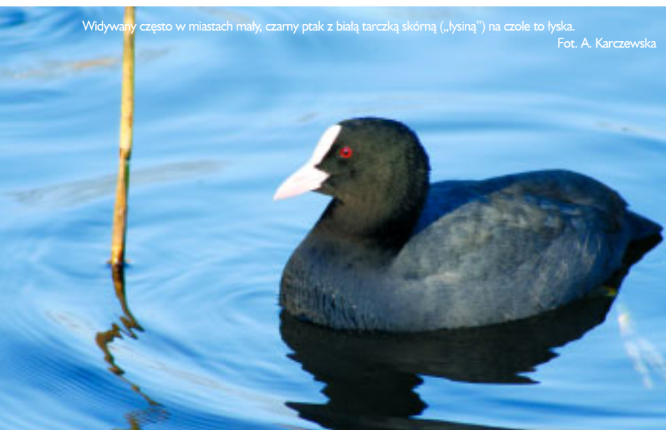
Widwany często w miastach mały, czarny ptak z białą tarczką skórną („łysiną”) na czole to łyska.

Olbrzymia większość ptaków podlega ochronie ścisłej na mocy rozporządzenia Ministra Środowiska z dnia 28 września 2004 r. , w sprawie gatunków dziko występujących zwierząt objętych ochroną (Dz. U. Nr 220, poz. 2237). Dziewięć gatunków ptaków, w tym mewa srebrzysta i białogłowa, podlega na mocy tego aktu ochronie częściowej . W stosunku do gatunków z obu tych grup stosuje się zakazy określone w § 6 rozporządzenia, m.in. zakaz umyślnego zabijania, okaleczania, płoszenia, chwytania i przetrzymywania. Od niektórych zakazów prawo przewiduje możliwość odstępstwa tylko w ściśle określonych sytuacjach.