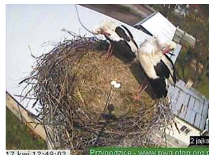
Zrzut z kamery internetowej.