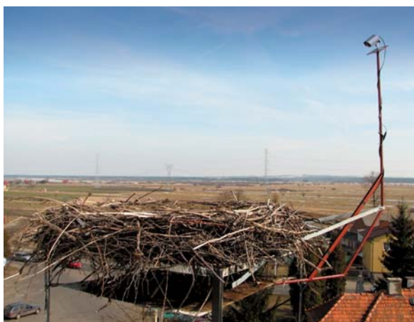
Gniazdo z kamerą i widoczną w tle Doliną Baryczy. Paweł T. Dolata

Bocian biały to zdecydowanie „najbardziej polski ptak”. Gniazduje u nas ok. 50 tys. par, czyli ok. 1/4 jego światowej populacji. Ptak ten ma stałe i wyjątkowe miejsce nie tylko w polskim krajobrazie, ale też w kulturze.